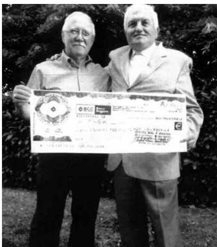
Il momento della consegna dell'offerta